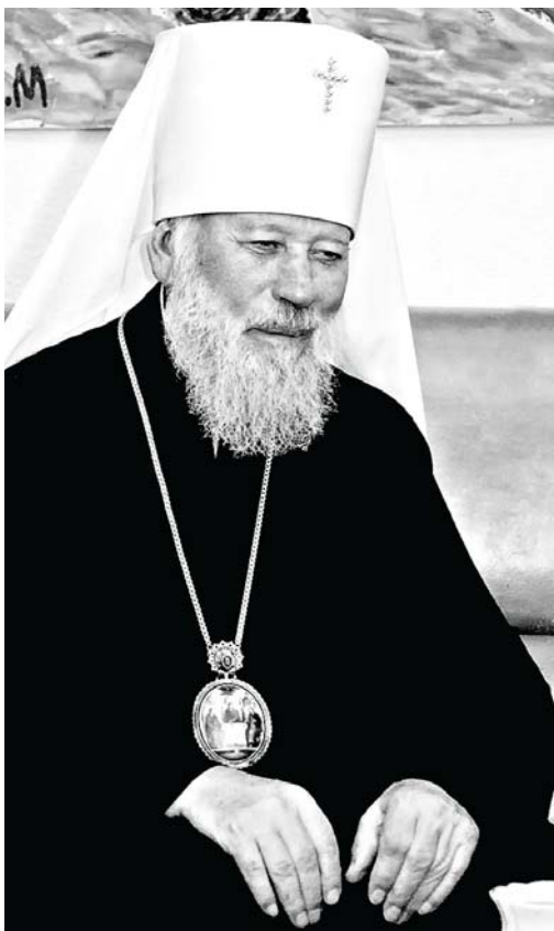
Блаженнейший Митрополит Владимир в Николаевской облгосадминистрации в 2005 году.

Р азмышляя о Боге, мы общаемся с Богом. Размышляя о Боге, мы обогащаем себя, размышляя о Боге, мы укрепляемся в любви к Нему, а Его любовь неизменна, постоянна к нам.