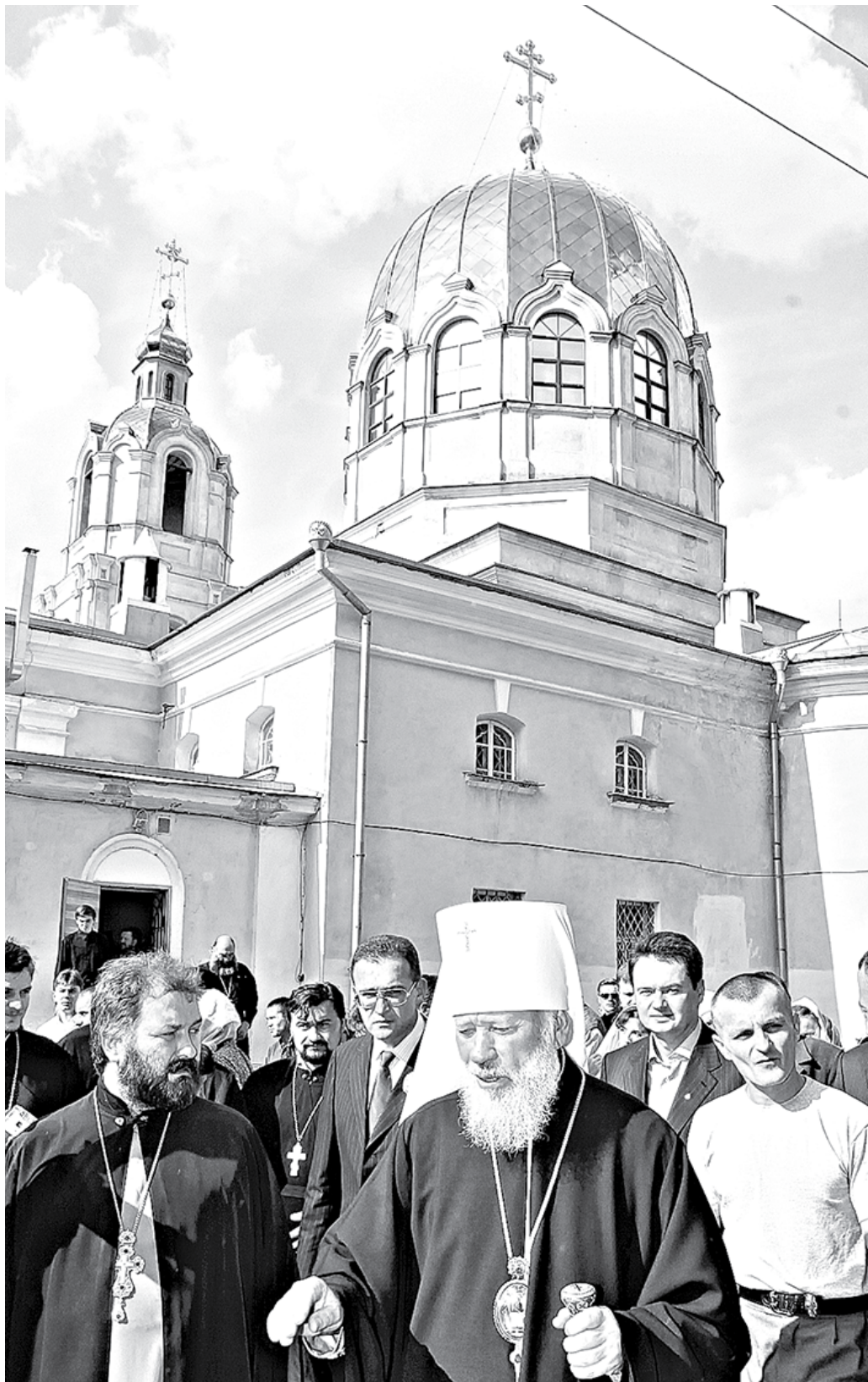
Блаженнейший Митрополит Владимир с николаевцами во дворе кафедрального собора. Октябрь 2005 года.

Мы счастливы, братья и сестры, что имеем веру во Христа и Бога, верим в Церковь, и, принимая церковную науку, вслушиваемся внимательно в науку нашей правой веры. Берегите эту веру в своих сердцах до последнего своего издыхания, ибо это залог, данный нам Богом при нашем рождении и крещении. И вера может многие чудеса совершить, особенно в деле нашего совершенствования, нашего спасения. Возлюбим же Господа Бога всем сердцем своим, всею душою, всем разумением своим, а ближнего своего как самого себя. И тогда будем уверенны, что Господь всегда с нами и в этой жизни, и в жизни будущего века. Аминь.