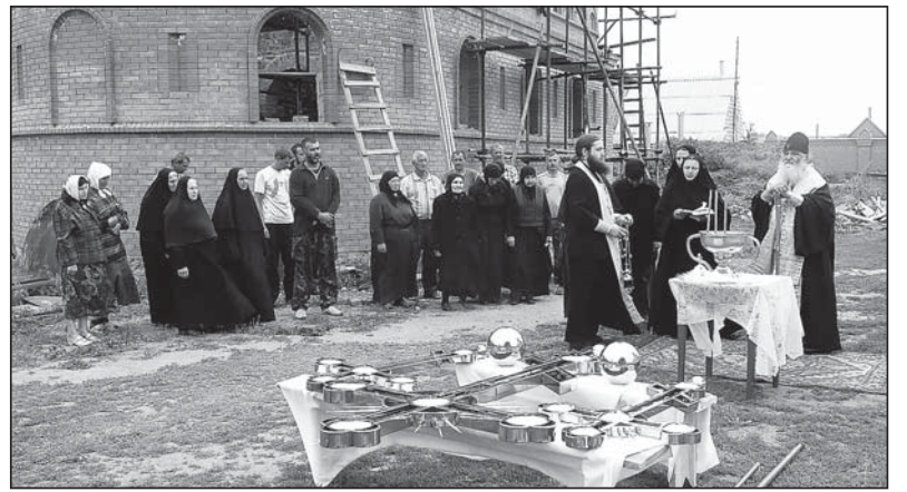
Освящение крестов для купола зимней церкви в Свято-Михайловском Пелагеевском монастыре

В этот же день Владыка посетил с. Гурьевку Новоодесского района, где также освятил крест и колокола для храма.