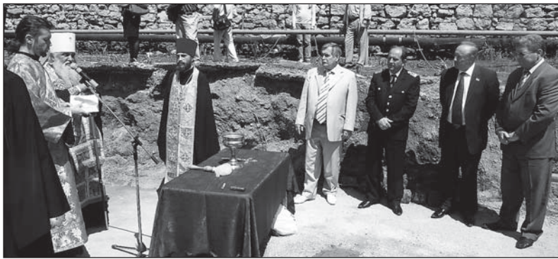
Митрополит Питирим совершает закладку часовни в морском порту