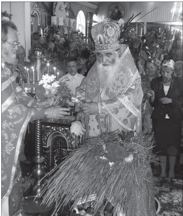
Освящение зелени в Свято-Духовском храме Корабельного района в день Святой Троицы