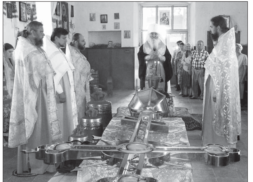
Освящение креста и колоколов в с. Гурьевке Новоодесского района