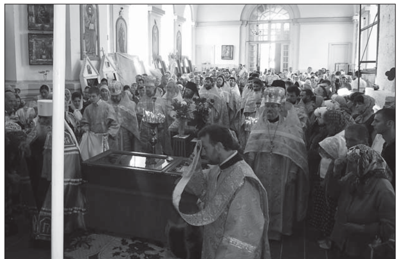
Престольный праздник в мужском монастыре святых равноапостольных Константина и Елены