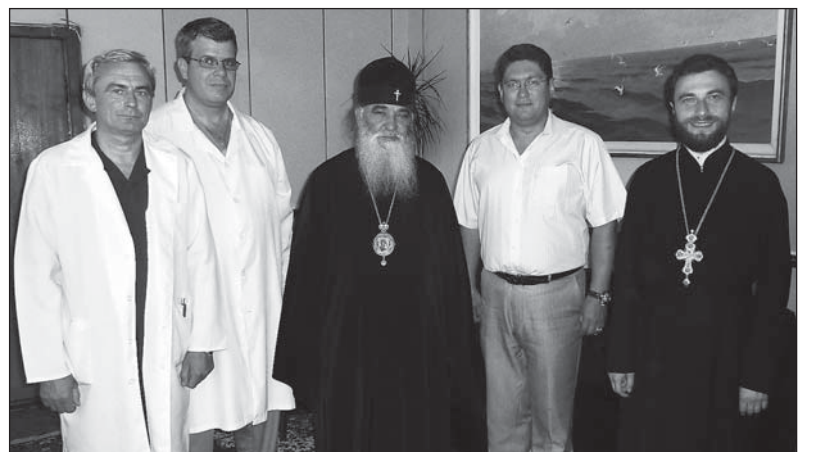
После освящения операционного блока в БСМП