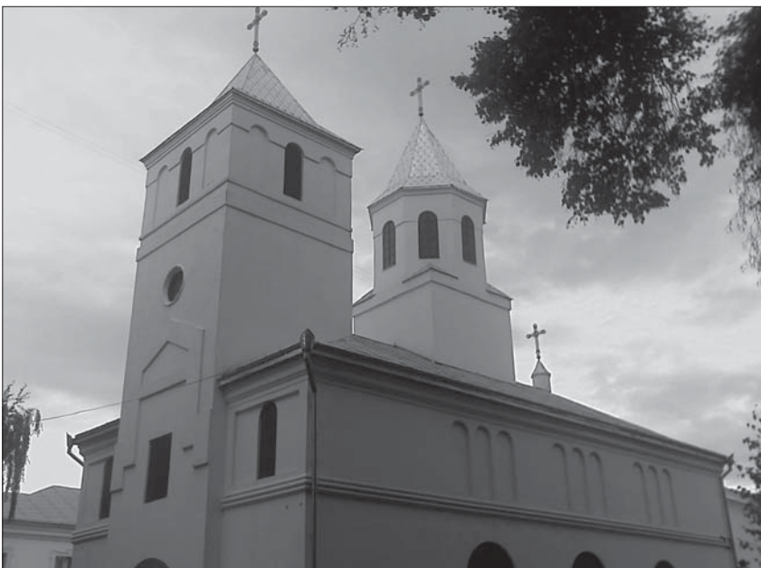
Свято-Покровський храм (у військовому шпиталі, м. Чернівці)

Прихід Свято-Покровського храму – справжня велика дружна сім'я. Отець Іоанн проводить зі своєю паствою духовні бесіди (для цього він спеціально вивчив мову жестів), ділиться переживаннями. Свята вони також проводять разом. Звичайні прихожани не залишаються осторонь цього. Вони також є частиною цієї родини і допомагають своїм братам та сестрам у всьому. Колектив цього приходу яскраво ілюструє слова Свято Писання: «Друг друга тяготы носите и тако исполните закон Христов» (Гал. 6, 2).