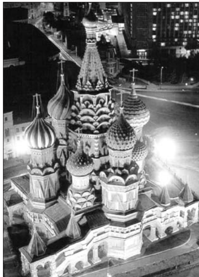
Покровський собор, саме так освячен цей всім відомий храм

Усвідомлення Матері Божої як «непереможної Перемоги», перед любов'ю і милосердям якої не можуть встояти ніякі сили зла,