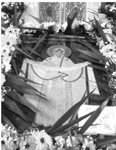
ікона Покрови Пресвятої Богородиці

Деякі наші князі на своїх печатках використовували іконки Божої Матері або молитви до Неї. В новіших часах знайдено в Україні дуже старовинні золоті, бронзо-