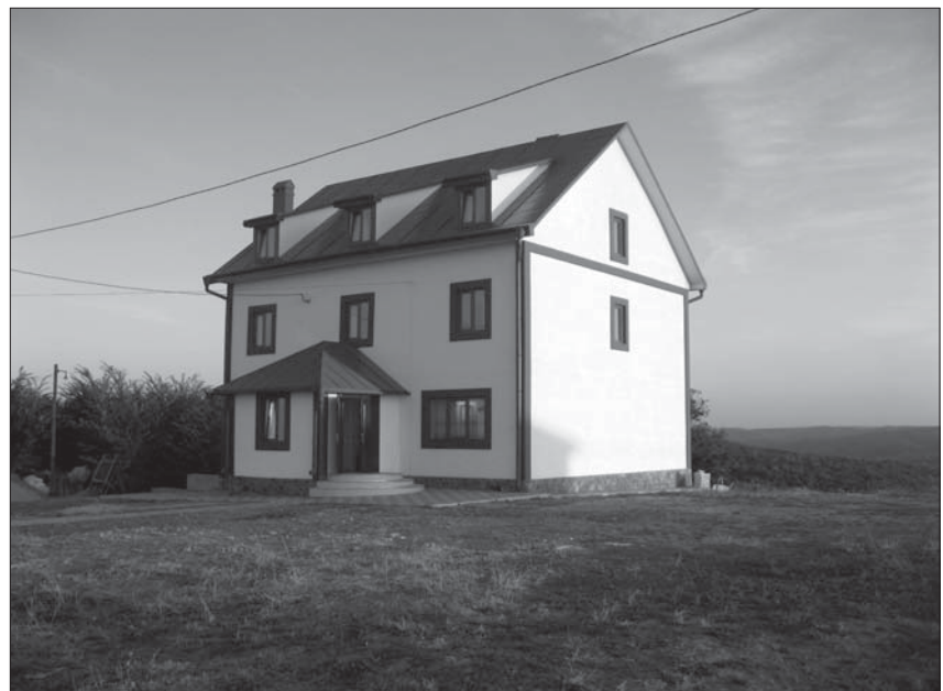
новий монастирський корпус