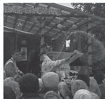
владика кропить прихожан святою водою