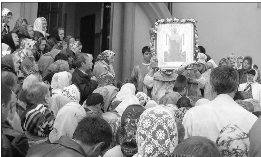
Свято-Покровський храм, престольне свято. Жовтень 2008

Скоріше за все, далася взнаки киеворуська традиція пошанування мирськими людьми монахів, чернечого ладу життя як «світла для світу», квінтесенції та зразка християнського життя, ідеалу спасіння. Як у Київській Русі князі та воїни часто завершували життєвий шлях постригом, так і козацтво – армія під Покровом Богородиці, шанувала чернецтво (та й з білим духовенством, із братськими школами підтримувала плідні зв'язки); до всього, запорожці під старість часто переселялися в монастир. На цьому ґрунті виникало багато переказів та легенд. Відома легенда, про те, як козацький полковник Семен Палій постригся в ченці. (Але насправді він тільки був похований у Межигірському монастирі). Нехай же кожен з нас на свято Покрови поставить дві свічки, вознесе дві молитви: і за живих, хто нині трудиться на благо Вітчизни земної й небесної, і за усопших – воїнів січових та келійних, наших славних предків. Усі ми – під святим вічним Омофором Богородиці, де вистачить місця і мертвим, і живим, і ще не народженим. ✝